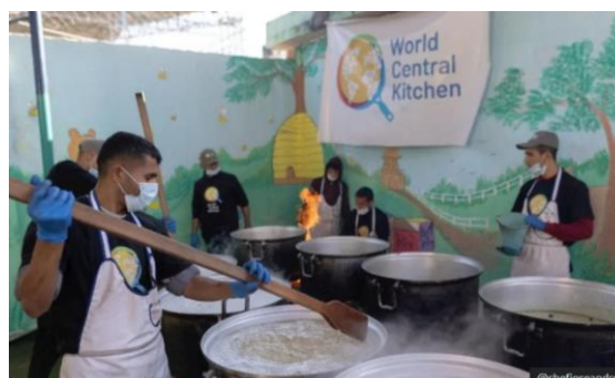
Gambar III. Para pekerja kemanusiaan World Central Kitchen menyiapkan makanan untuk masyarakat Palestina

Pada bulan Oktober 2023, banyak masyarakat Palestina yang mengungsi ke selatan Gaza, yaitu Rafah. Hal ini menyebabkan meningkatnya penduduk Rafah dari 250.000 menjadi 1,2 juta jiwa (Ferguson, 2024). WCK menyediakan makanan di kamp, rumah sakit, dan sekolah yang telah menjadi tempat penampungan bagi masyarakat. Selain itu, WCK turut bekerjasama dengan Anera dan UNRWA untuk memberikan perlengkapan makanan di Khan Younis dan di perbatasan Mesir.