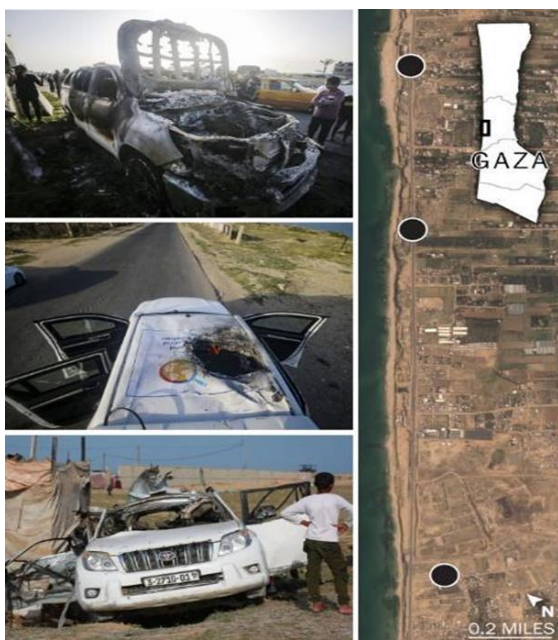
Gambar VI. Tiga Kendaraan WCK diserang Israel yang berakibat jatuhnya korban pekerja kemanusiaan

Tujuh pekerja relawan kemanusiaan yang ditugaskan oleh WCK tewas pada 1 April 2024 akibat serangan udara yang dilakukan oleh Israeli Defense Forces (IDF) terhadap tiga mobil operasional termasuk dua mobil lapis baja WCK yang telah diberi logo WCK di atasnya. Kejadian penyerangan ini terjadi ketika tim WCK meninggalkan Gudang Deir l-Balah, tempat dimana mereka menurunkan lebih dari 100ton bantuan pangan kemanusiaan yang dibawa melalui jalur laut Gaza (Alcini et al., 2024) Korban-korban dalam kejadian ini merupakan berkewarganegaraan Australia, Kanada/Amerika Serikat (bipatriide), Gaza, Polandia, dan Inggris.