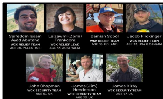
Gambar IV. Identitas tujuh korban penyerangan IDF 1 April 2024

Dengan banyaknya wilayah yang diberi batuan dan organisasi lokal yang bermitra dengan WCK, sangat memungkinkan bahwa organisasi ini terbuka kepada staf dan relawan berasal dari seluruh dunia, terlebih dalam membantu upaya pemulihan kondisi kelaparan di Gaza dan diseluruh dunia. Untuk mempersiapkan operasional, melatih tim lokal dan memastikan standar penyediaan makanan yang tinggi, WCK sering mengundang koki, ahli logistik dan staf pendukung lainnya dari berbagai negara (World Central Kitchen, 2023). Hal ini terbukti dari ditemukannya 6 relawan WCK berkewarganegaraan asing tewas akibat serangan udara yang di lakukan oleh militer Israel pada 1 April 2024, seperti yang dapat dilihat pada gambar dibawah.