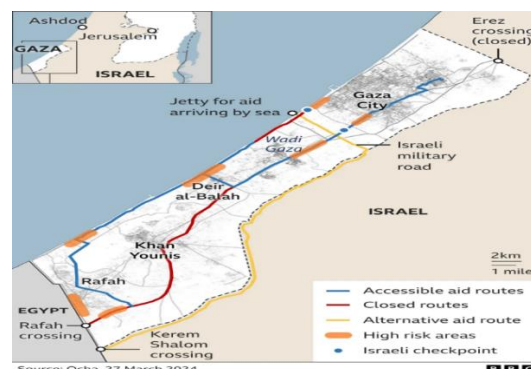
Gambar V. Peta Akses keluar dan masuk ke Gaza

Meskipun memiliki mitra dan jaringan distribusi dalam skala global, namun akibat adanya pembatasan jumlah truk bantuan yang masuk di wilayah perbatasan dan rusaknya infrastruktur, WCK tetap menghadapi masalah akan terbatasnya sumber daya yang dapat mendukung operasional di lapangan. Oleh karena itu, ketidakpastian konsisi lapangan ditengah invasi militer yang tidak kunjung selesai membuat angka kelaparan semakin meningkat setiap harinya, hal ini membuat permintaan bantuan kemanusiaan terhadap makanan semakin tinggi. Peta dibawah menunjukkan sulitnya akses rute bantuan ke Gaza, bahkan untuk rute yang dapat diaksespun (jalur warna biru), masih terdapat kawasan berisiko tinggi.