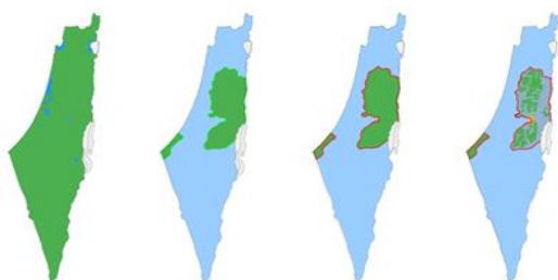
Gambar I. Peta Palestina tahun 1947-2023