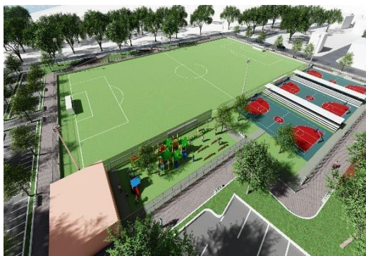
Gambar 1 1 Lapangan Olahraga (Penulis, 2023)

Lapangan olahraga ini memiliki konsep sehat aktif, Maksud dari konsep Ini untuk memberikan fasilitas olahraga seluruh kalangan masyarakat yang dapat di fungsikan dengan standar untuk olah Raga, Pada Lapangan Ini dilengkapi kursi dan tempat Sampah. Untuk Fasilitas penunjang yang ada di lapangan olah raga ini ada taman bermain bagi anak-anak, jogging track, lapangan basket, lapangan bola, parkir, WC umum dan tribun.