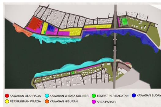
Gambar 4 Penataan Kawasan

Pada Perencanaan Penulis setelah menganalisis kondisi saat ini dengan melihat aturan dari pemerintah dalam mengatur pembagian wilayah dan tata guna lahan tepian Sambaliung, akan dibuat penzoningan wilayah yang lebih terarah, demi menunjang perekonomian desa dan kesehatan masyarakat.