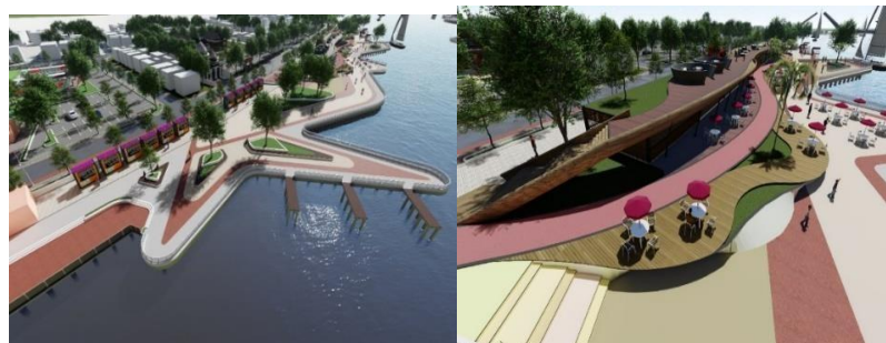
Gambar 14 Kawasan Kuliner