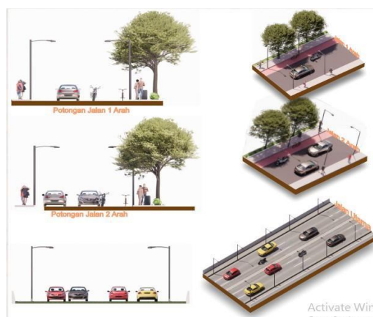
Gambar 9 Tata Jalur Pejalan Kaki (Sumber : Penulis 2023)

Untuk konteks pedestrian, sarana sebagaimana yang disebutkan dalam Pedoman Penyediaan dan Pemanfaatan Sarana dan prasarana Ruang Pejalan Kaki di Perkotaan, Peraturan Menteri Pekerjaan Umum Nomor: 03/PRT/M/2014 adalah fasilitas pendukung jalur pejalan kaki yang dapat berupa bangunan pelengkap petunjuk informasi maupun alat penunjang lainnya yang disediakan untuk meningkatkan kenyamanan dan keamanan pejalan kaki. Sarana ini berguna untuk meningkatkan kenyamanan, keamanan dan keselamatan serta aksesibilitas para pejalan kaki dalam melakukan mobilitas. Berdasarkan Pedoman Penyediaan dan Pemanfaatan Sarana dan prasarana Ruang Pejalan Kaki di Perkotaan, drainase terletak berdampingan atau dibawah dari ruang pejalan kaki. Drainase berfungsi sebagai penampung dan jalur aliran air pada ruang pejalan kaki. Dimensi minimal adalah lebar 50-centimeter dan tinggi 50 centimeter.