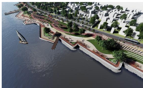
Gambar 10 Perencanaan Ruang Terbuka

Ruang terbuka ( Open Space ) merupakan ruang terbuka yang selalu terletak di luar massa bangunan yang dapat dimanfaatkan dan dipergunakan oleh setiap orang serta memberikan kesempatan untuk melakukan bermacam-macam kegiatan. Yang dimaksud dengan ruang terbuka antara lain jalan, pedestrian, taman lingkungan, plaza, lapangan olahraga, taman kota dan taman rekreasi (Hakim, 2003 ). Ruang terbuka hijau memperbaiki dan menjaga iklim makro dan nilai estetika, meresapkan air, menciptakan keseimbangan dan keserasian lingkungan fisik kawasan, dan mendukung pelestarian keaneka ragaman dan mengisi vegetasi berupa tumbuhan dan tanaman di kawasan perkotaan dan pemanfaatannya bagi masyarakat baik dari segi ekologi, sosial, budaya, ekonomi dan estetika.