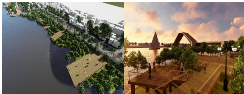
Gambar 1 3 Hutan Mangrove

Area Hutan mangrove Ini didesain agar pengunjung yang datang dapat berjalan jalan sambil menikmati asrinya hutan bakau yang diiringi tarian monyet bekantan dan burung sungai dipepohonan hutan mangrove. Untuk Fasilitas penunjang yang ada di taman baca ini ada kursi, wc, tenan, parkir dan Tempat Selfi yang instagramnabel.