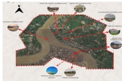
Gambar 2 View Tapak Rencana tata guna lahan

View Tapak Rencana tata guna lahan adalah untuk mengetahui perencanaan pemanfaatan potensi dan ruang pedesaan serta pengembangan infrastruktur pendukung yang dibutuhkan untuk mengakomodasi kegiatan social ekonomi yang diinginkan Menurut Malingreau (1979), penggunaan lahan merupakan campur tangan manusia baik secara permanen atau periodik terhadap lahan dengan tujuan untuk memenuhi kebutuhan, baik kebutuhan kebendaan, spiritual maupun gabungan keduanya. (Yunus,2000) menyatakan bahwa selain faktor ekonomi yang menjadi penentu penggunaan lahan, masih ada faktor- faktor lain yang juga mempengaruhi penggunaan lahan, seperti faktor sosial dan politik, tetapi factor ekonomi masih merupakan faktor yang dominan dan tidak dapat diabaikan dalam setiap analisis penggunaan lahan.