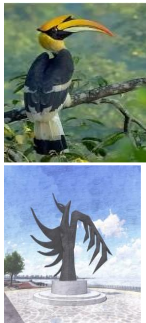
Gambar 7 Perencanaan Bentuk Tugu (Sumber : Penulis 2023)

Bentuk landmark adalah burung enggang mengambil dari bentuk satwa langka Kalimantan yang hampir punah keberadaannya, yang akan di terapkan di sekitar anjungan yang akan dirancang serta perencanaan petunjuk arah dan batas kawasan. Perencanaan kawasan tepian sungai sambaliung akan menerapkan bentuk tata massa linear agar memiliki system sirkulasi yang terarah dan teratur. Bentuk linier dapat dimanipulasi untuk membatasi sebagian. Bentuk linier dapat diarahkan secara vertical sebagai suatu menara untuk menciptakan sebuah titik dalam ruang. Bentuk linier dapat berfungsi sebagai unsur pengatur sehingga bermacam-macam unsur lain dapat ditempatkan disitu.