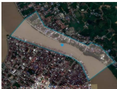
Gambar 1 Lokasi Site

Tepian Sungai Sambaliung terletak di Kabupaten Berau di Kecamatan Sambaliung, merupakan kawasan wisata, kawasan suaka alam, pelestarian alam, dan cagar budaya. Luas wilayah Sambaliung 2.167,37 km dan jumlah penduduk sebanyak 36.839 jiwa. Kecamatan Sambaliung terdiri atas 6 Desa yaitu, Desa Bebanir, Desa Bena Baru, Desa Gurimbang, Desa Inaran, Desa Suaran, dan Desa Sambaliung