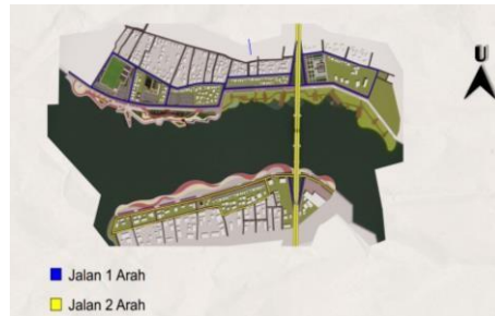
Gambar 8 Perencanaan Sirkulasi Parkir

1985), dimana Sistem sirkulasi merupakan prasarana penghubung yang vital dalam menghubungkan berbagai kegiatan dan penggunaan suatu lahan di atas suatu area yang mempertimbangkan aspek fungsional, ekonomis, keluwesan dan kenyamanan. Aksesibilitas adalah hal yang penting untuk daerah pariwisata sedangkan kemampuan orang untuk mengakses suatu tempat menjadi indikator Kualitas hidup masyarakat setempat, sehingga dengan ini diperlukannya penataan system sirkulasi dan parkir yang baik pada sebuah kota.