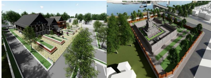
Gambar 1 2 Wisata Budaya (Penulis, 2023)

Kawasan wisata budaya ini dirancang agar mempunyai daya tarik sebagai salah satu cagar budaya yang ada di tepian sambaliung. Didalam Kawasan wisata budaya itu ada Kraton kesultanan sambaliung dan Pura agung nata giri adapun tambahan perencanaan berupa tempat parkir dan papan informasi serta museum tempat penyimpanan benda-benda sejarah yang ada di Kraton kesultanan sambaliung, kawasan ini juga di pakai untuk acara adat dan ibadah setiap tahunnya.