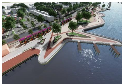
Gambar 5 Perencanaan Kawasan Kuliner