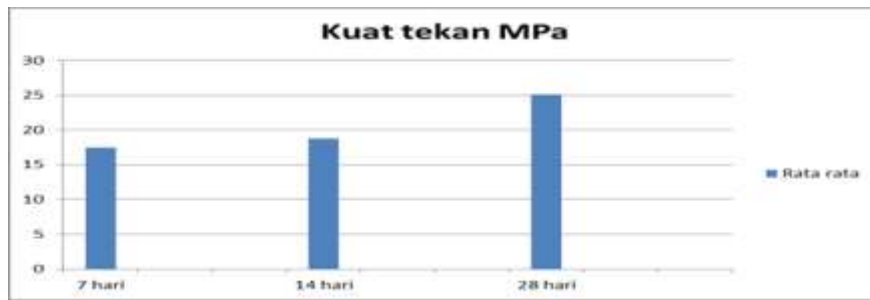
Gambar IV. 4. Diagram Kuat tekan Beton rata-rata

Berdasarkan gambar IV.4 diatas, dapat dijelaskan bahwa pengaruh penggunaan agregat sungai Mamasa Tabang terhadap pengaruhnya pada kuat tekan beton semakin meningkat yaitu semakin bertambah umur beton maka nilai kuat tekannya semakin besar yaitu 25.10 >25 Mpa yang di targetkan.