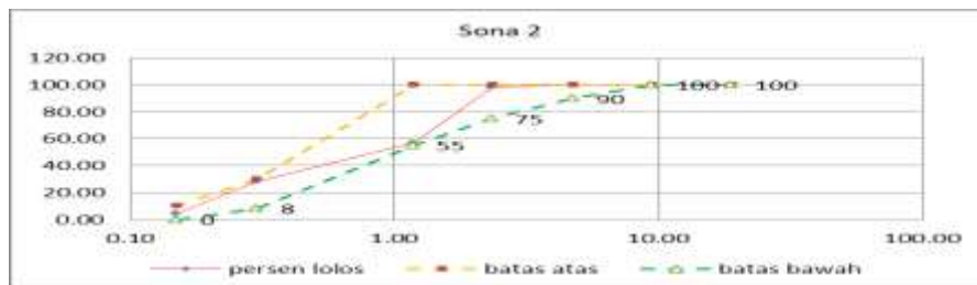
Gambar IV. 1. Gradasi Saringan Agregat Halus

Pada Gambar IV.1 merupakan Grafik yang menunjukkan bahwa Agregat (pasir) sungai Mamasa Tabang dapat dikatakan lolos sesuai spesifikasi.